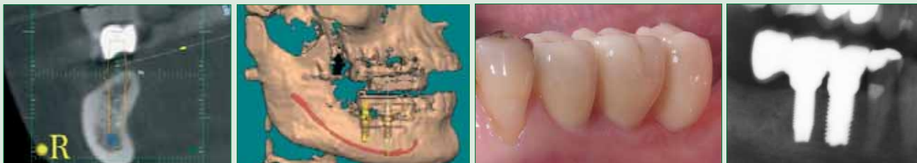
Abb. 3 (von links nach rechts): Planung des Implantates (orange) in optimaler Abhängigkeit zum Knochen (grau), Unterkiefernerve(n) (blau) und der späteren Krone (weiß). Simulation der Implantate im dreidimensionalen Volumentomogramm unter Berücksichtigung des Unterkiefernerve(n) (rot). Zustand nach Einsetzen der Vollkeramikbrücke auf den Zirkonimplantaten – der Zahn ganz rechts ist ein Anhängerbrückenglied, die beiden mittleren Zähne die Implantate und der Zahn links ist ein natürlicher Zahn. Hier ist das Zahnfleischniveau schlechter als bei den Implantatzähnen! Röntgenkontrollaufnahme der Anhängerbrücke. Vollständig metallfreie Rekonstruktion aus nur drei Komponenten: Keramikbrücke mit Glasionomerzement auf den einteiligen Keramikimplantaten zementiert.