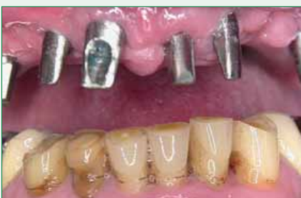
Abb. 1: Versorgung mit Titanimplantaten und entzündetem Zahnfleisch

Titan und andere dentale Edelmetalle haben diese zwei Faktoren zwar häufig erfüllt, die sichere Voraussagbarkeit ist allerdings nicht gegeben, da Titan und andere Metalle Zahnbelag geradezu magnetisch anziehen und andererseits im ständig zunehmenden elektromagnetischen und Skalarwellen-Feld der Mobilfunknetze und Bluetoothfelder unkontrollierbare Belastungen für den Patienten mit sich bringen.